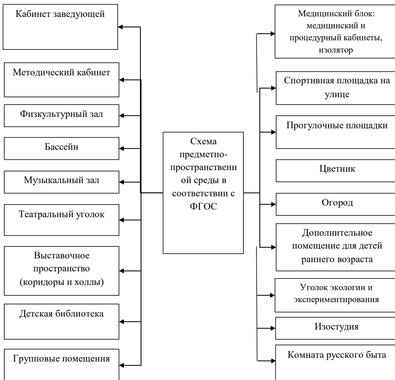
Схема предметно-пространственной среды в соответствии с ФГОС